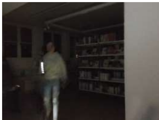
Mit der Taschenlampe auf der Suche nach einem Posten.